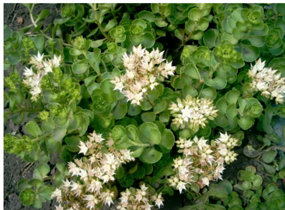
Седум ложный белый ▲ и малиновый ▼